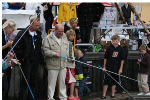
Jordbruksminister Eskil Erlandsson metar vid Svenskt Friluftslivs kajplats under Almedalsveckan.